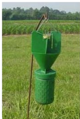
Esempio di trappola

Rappresenta un aspetto fondamentale per conoscere la reale diffusione dell'insetto e i suoi comportamenti