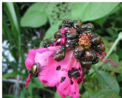
Attacco su rosa

Per gli ingenti danni economici che può provocare Popillia japonica è considerata dalla normativa fitosanitaria un organismo nocivo da quarantena.