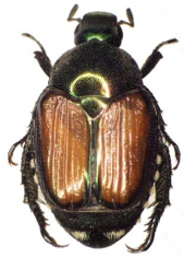
Adulto di Popillia japonica

Popillia japonica Newman (Coleoptera Rutelidae) è una specie originaria del Giappone, ma è presente in altri Paesi, tra cui gli Stati Uniti. In Europa era nota solo nelle Isole Azzorre (Portogallo), mentre non era presente in Europa continentale